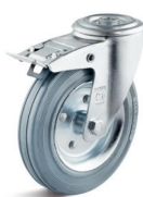
1-DSN (vidlice se středovým upevňovacím otvorem a zadní brzdou)

Vhodné příslušenství najdete na straně 432 a násl.