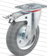
3-DSN (vidlice s destičkou a zadní brzdou)

Vhodné příslušenství najdete na straně 432 a násl.