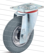
-3 (vidlice s destičkou)