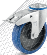
1-DSN (vidlice se středovým upevňovacím otvorem a zadní brzdou)

Vhodné příslušenství najdete na straně 432 a násl.