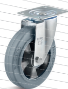
-3 (vidlice s destičkou)