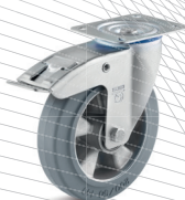
3-DSN (vidlice s destičkou a zadní brzdou)

Vhodné příslušenství najdete na straně 432 a násl.