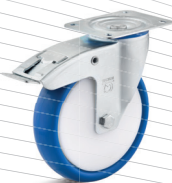
3-DSN (vidlice s destičkou a zadní brzdou)

Vhodné příslušenství najdete na straně 432 a následující.