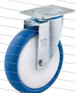
-3 (vidlice s destičkou)