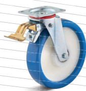
3-DSV (vidlice s destičkou a přední brzdou)