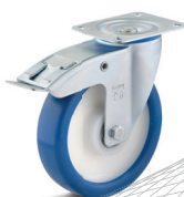
3-DSN (vidlice s destičkou a zadní brzdou)