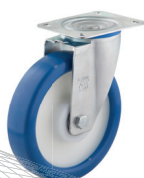
-3 (vidlice s destičkou)

„Středový upevňovací otvor u pojezdových kol o průměru 160 a 200 mm volitelně s průměrem 12 nebo 16 mm“