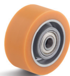
Kola o průměru 100 mm

Vhodné příslušenství najdete na straně 432 a násl.