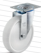
-3 (vidlice s destičkou)