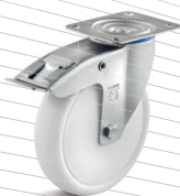
3-DSN (vidlice s destičkou a zadní brzdou)

Vhodné příslušenství najdete na straně 432 a násl.