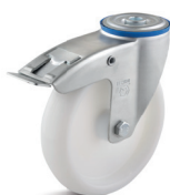
1-DSN (vidlice se středovým upevňovacím otvorem a zadní brzdou)

Vhodné příslušenství najdete na straně 432 a násl.