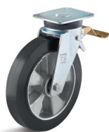
3-DSV (vidlice s destičkou a přední brzdou)

Vhodné příslušenství najdete na straně 432 a násl.