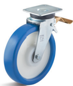
3-DSV (vidlice s destičkou a přední brzdou)

Vhodné příslušenství najdete na straně 432 a následující.