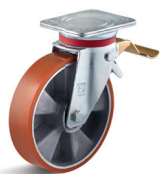
3-DSV (vidlice s destičkou a přední brzdou)