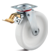
3-DSV (vidlice s destičkou a přední brzdou)

Vhodné příslušenství najdete na straně 432 a násl.