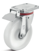
3-DS-P (vidlice s destičkou + aretace destičky)