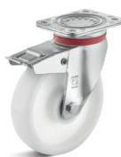
3-DSN (vidlice s destičkou a zadní brzdou)

Vhodné příslušenství najdete na straně 432 a násl.