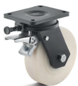
S brzdou kola

Vhodné příslušenství najdete na straně 432 a násl.