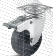
3-DSN (vidlice s destičkou a zadní brzdou)

Vhodné příslušenství najdete na straně 432 a následující.