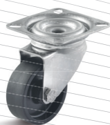
-3 (vidlice s destičkou)