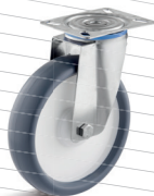
-3 (vidlice s destičkou)