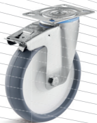
3-DSN (vidlice s destičkou a zadní brzdou)

Vhodné příslušenství najdete na straně 432 a násl.