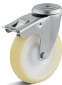
1-DSN (vidlice se středovým upevňovacím otvorem a zadní brzdou)

Vhodné příslušenství najdete na straně 432 a násl.