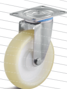
-3 (vidlice s destičkou)