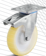
3-DSN (vidlice s destičkou a zadní brzdou)

Vhodné příslušenství najdete na straně 432 a následující.