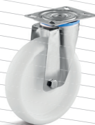
-3 (vidlice s destičkou)