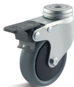
1-DSN (vidlice se středovým upevňovacím otvorem a zadní brzdou)

Vhodné příslušenství najdete na straně 432 a násl.