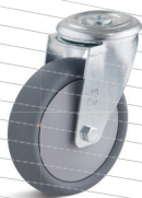
-1 (vidlice se středovým upevňovacím otvorem)