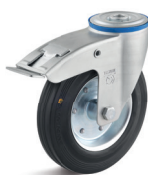
1-DSN (vidlice se středovým upevňovacím otvorem a zadní brzdou)

Vhodné příslušenství najdete na straně 432 a násl.