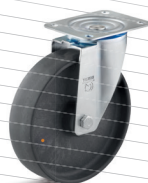
-3 (vidlice s destičkou)