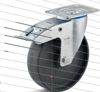
3-DSN (vidlice s destičkou a zadní brzdou)

Vhodné příslušenství najdete na straně 432 a následující.