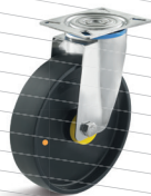
-3 (vidlice s destičkou)