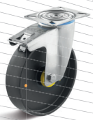
3-DSN (vidlice s destičkou a zadní brzdou)

Vhodné příslušenství najdete na straně 432 a násl.