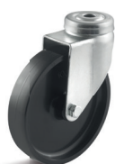
-1 (vidlice se středovým upevňovacím otvorem)