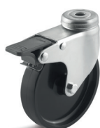
1-DSN (vidlice se středovým upevňovacím otvorem a zadní brzdou)