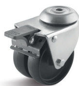
1-DSN (vidlice se středovým upevňovacím otvorem a zadní brzdou)