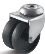
-1 (vidlice se středovým upevňovacím otvorem)