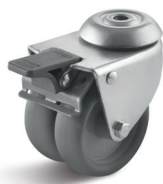
1-DSN (vidlice se středovým upevňovacím otvorem a zadní brzdou)