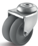
-1 (vidlice se středovým upevňovacím otvorem)