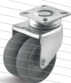
-3 (vidlice s destičkou)