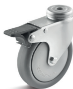
1-DSN (vidlice se středovým upevňovacím otvorem a zadní brzdou)