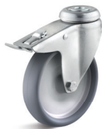
1-DSN (vidlice se středovým upevňovacím otvorem a zadní brzdou)

Vhodné příslušenství najdete na straně 432 a násl.