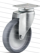
-3 (vidlice s destičkou)