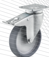
3-DSN (vidlice s destičkou a zadní brzdou)

Vhodné příslušenství najdete na straně 432 a násl.