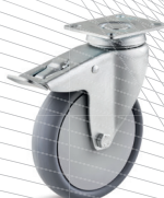
3-DSN (vidlice s destičkou a zadní brzdou)

Vhodné příslušenství najdete na straně 432 a násl.