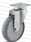
-3 (vidlice s destičkou)